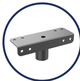
Accessorio testa per palo / Pole adaptor